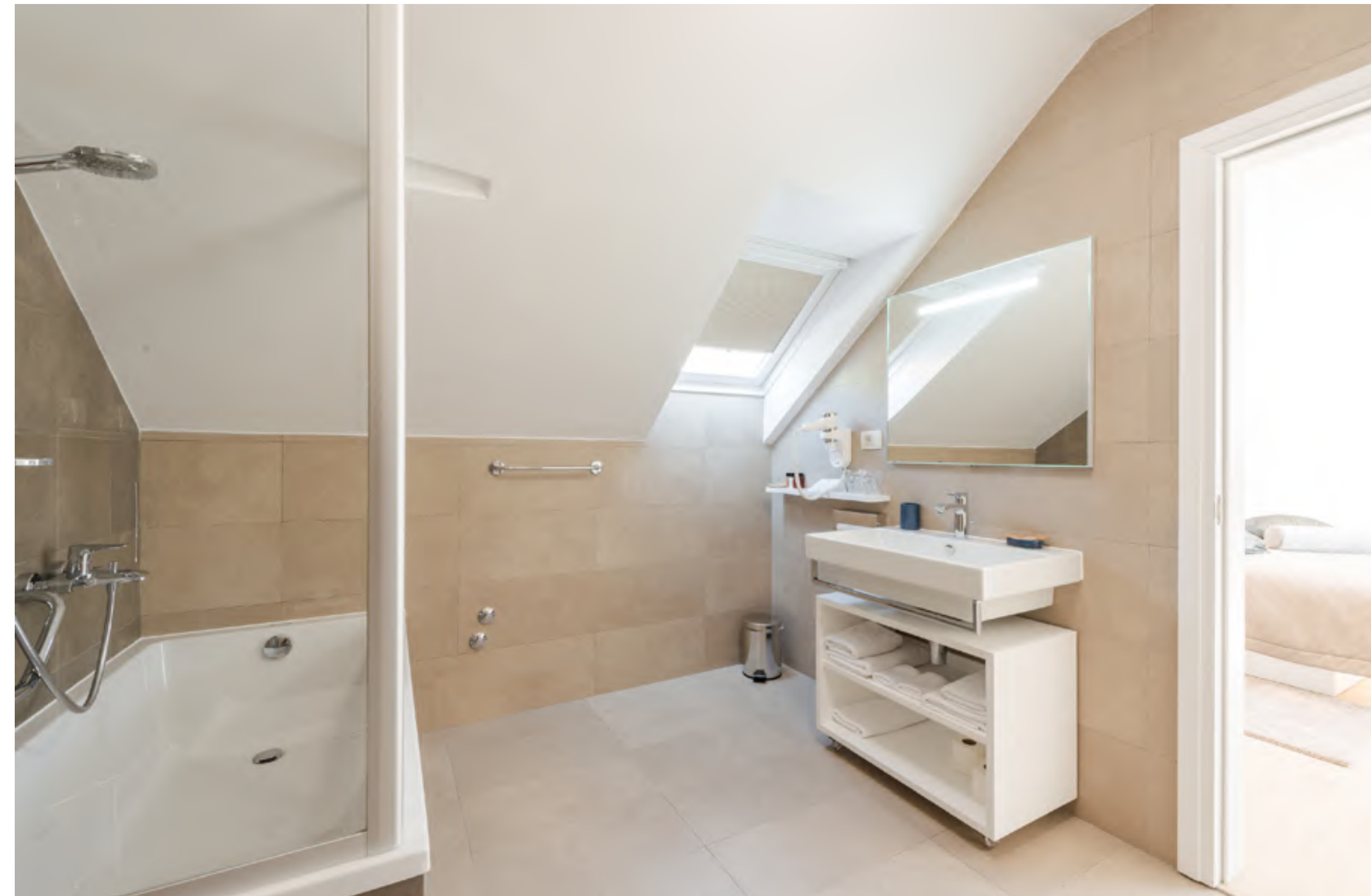
Das ist der perfekte Ort um sich zu verwöhnen